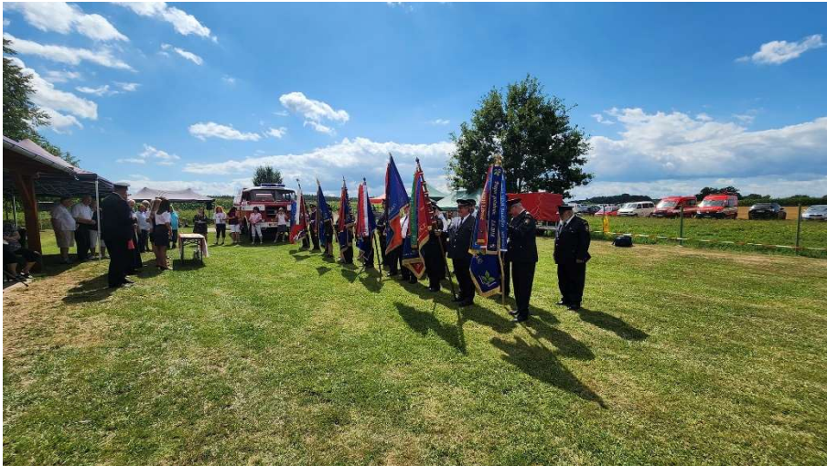
Oslavy 130. založení sboru 2024